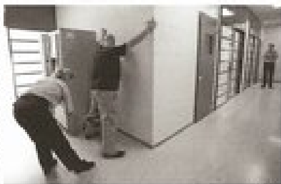
Una funcionaria revisita parte del casero antes del ingreso

Desde ahora, todo contacto con el exterior se limitará, a lo sumo, a cinco llamadas telefónicas de ocho minutos de duración entre semana, dos de veinte minutos